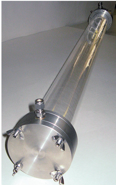
Abbildung 4: Arbeitsrohr